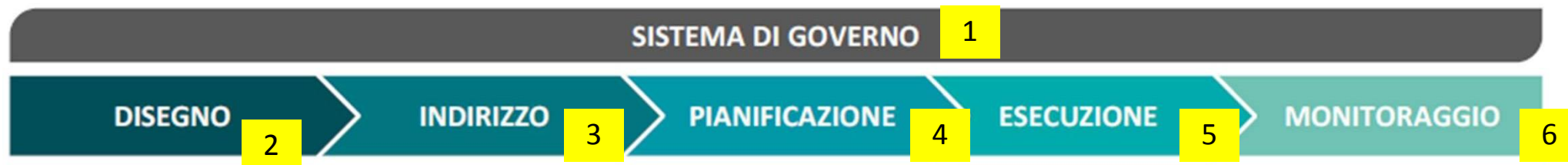
Figura 1 – Fasi del Modello del Ciclo di Vita del Digital Upskilling

MONITORAGGIO conclude l'illustrazione del Modello del Ciclo di Vita del Digital Upskilling, descrive il framework di monitoraggio e declina modalità e linee guida per la definizione degli indicatori di monitoraggio e controllo rispetto ai diversi livelli di valutazione dei percorsi formativi.