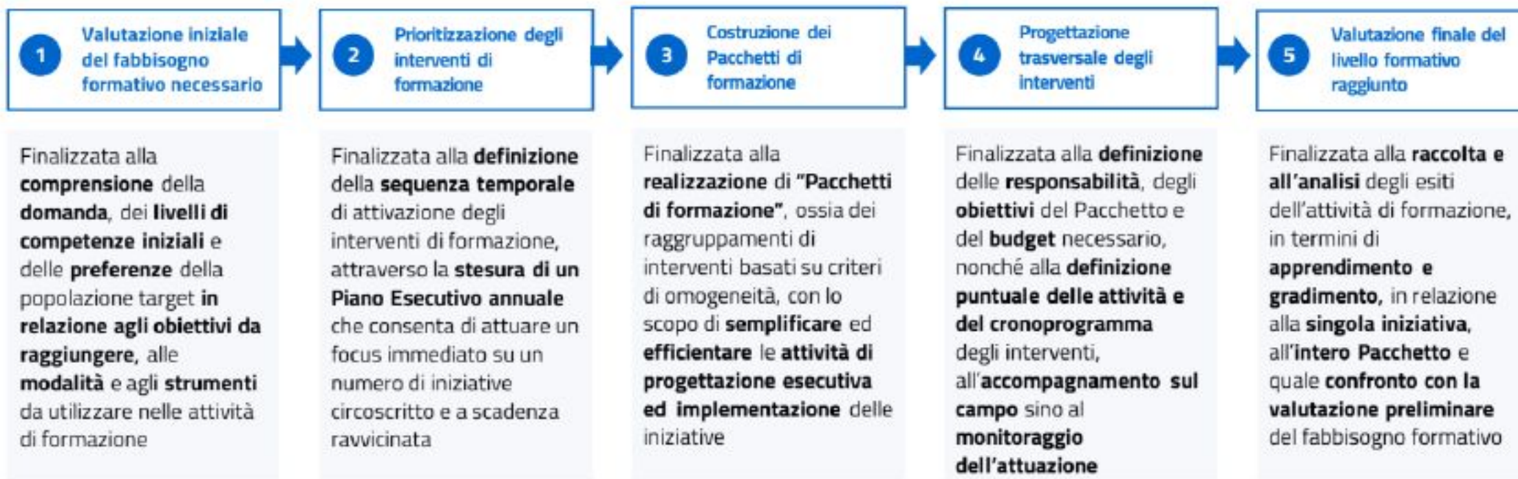
Fasi e finalità della strategia attuativa