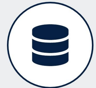
DATABASE PROGETTI EU