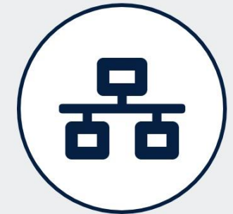
PROGETTI IN GESTIONE