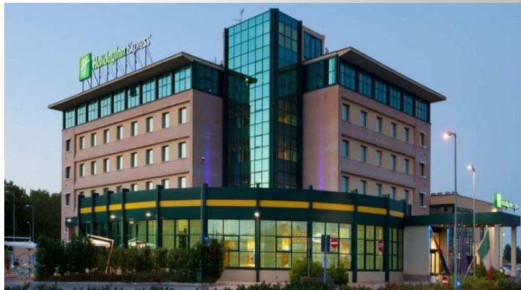
Sede del corso: Hotel Holiday Inn Express, Bologna