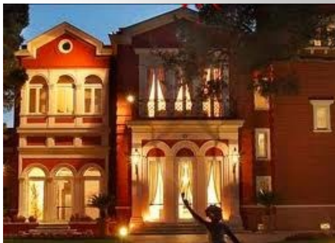
Sede del corso: Hotel Villa Romanazzi Carducci