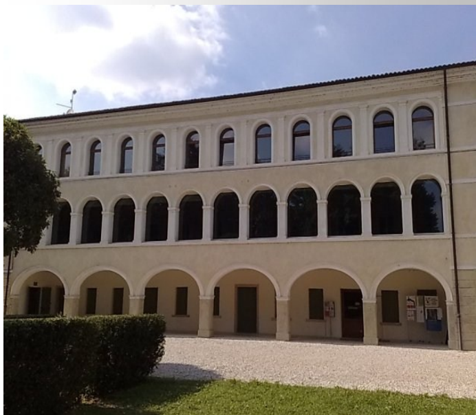
Villa Ancilotto - Crocetta del Montello (TV)

Verranno, inoltre, attivati specifici meccanismi per l'incentivazione e la partecipazione qualificata di tutti i destinatari alle politiche di salute in ambito Europeo ed Internazionale.