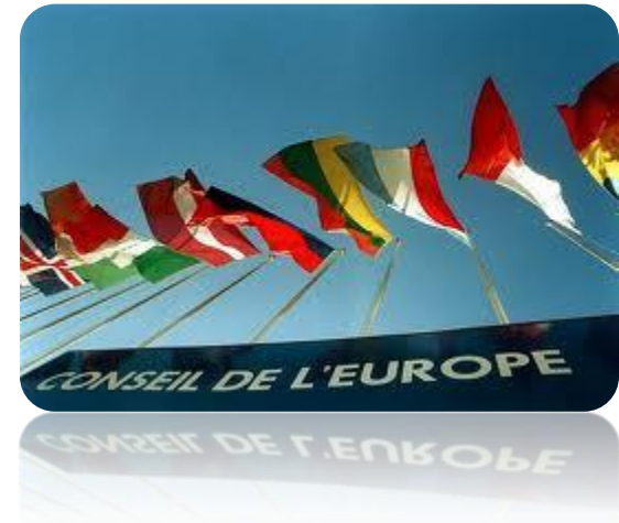
Council of Europe