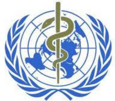
World Health Organization