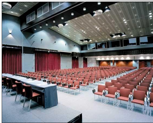
Sede del corso: Sala Riunioni - NH Laguna Palace

Il Progetto Dir-Mi intende, quindi, fornire un supporto al processo di implementazione della Direttiva e nello specifico accompagnare la creazione di un “sistema di relazioni e informazione” tra i diversi soggetti e le diverse iniziative progettuali coinvolti nel processo stesso di implementazione . La formazione residenziale, organizzata nell’ambito del Progetto Dir-Mi, intende soddisfare il fabbisogno formativo nei vari livelli, delineare i risultati attesi per ciascuna tematica affrontata, nonché definire indicazioni da dare ai decisori.