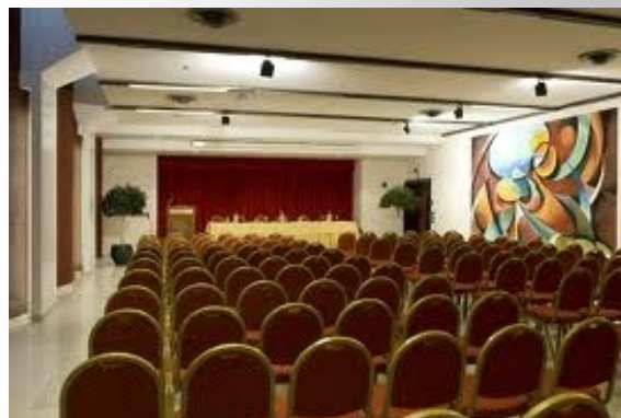
Sede del corso: Hotel dei Congressi, Roma

Il progetto, inoltre, ha attivato specifici meccanismi per l'incentivazione e la partecipazione qualificata di tutti i destinatari alle politiche di salute in ambito Europeo ed Internazionale.