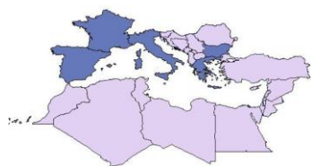
EpiSouth Plus Project WPs co-leadership