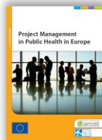
Project Management in Public Health in Europe (2011) – EAHC/DG Sanco