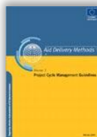
Project Cycle Management Guidelines (2004) – EuropeAid/DG Development